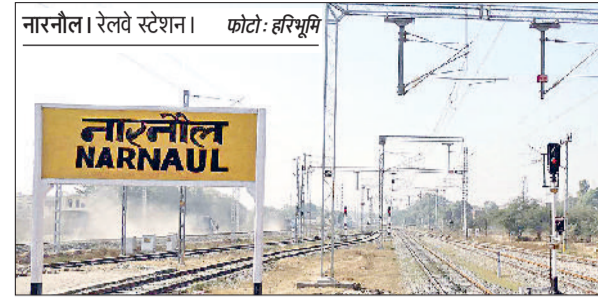
नारनौल रेलवे स्टेशन।

उत्तर पश्चिम रेलवे की ओर से जयपुर मण्डल के कनकपुरा स्टेशन यार्ड में तकनीकी कार्य हेतु नौन इण्टरलॉकिंग कार्य किया जाएगा।