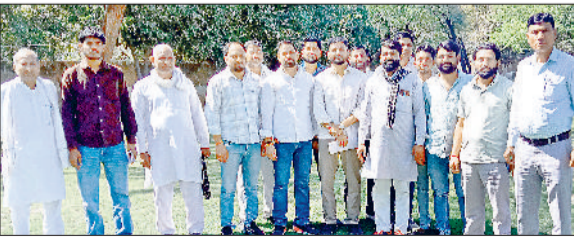
नारनौल। एसपी से मिलने लघु सचिवालय पहुंचे विभिन्न गांवों के सरपंच।

उन्होंने बताया कि इस पूरे घटनाक्रम की वीडियो भी मौजूद है, जिसमें आरोपित हथियारों से हमला करते हुए साफ दिखाई दे रहे हैं। उन्होंने बताया कि घटना को कई दिन बीत जाने के बावजूद भी अभी तक एक भी आरोपित को गिरफ्तारी नहीं हुई है। हमलावर खुलेआम गांव में घूम रहे हैं, जिससे गांव दोस्तपुर और आसपास के क्षेत्र में भय और दहशत का माहौल बना हुआ है। हम सभी सरपंच व ग्रामीण प्रतिनिधि मांग करते हैं कि इस मामले में वीडियो व