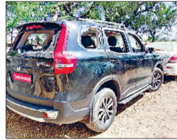
नारनौल। मृतक की क्षतिग्रस्त स्कार्पियो गाड़ी।