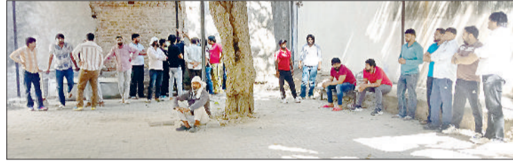
नारनौल। नागरिक अस्पताल की मोर्ची में बेटे ग्रामीण।